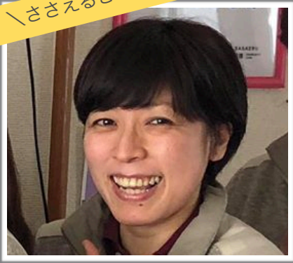
訪問看護ステーションささえるさん看護師